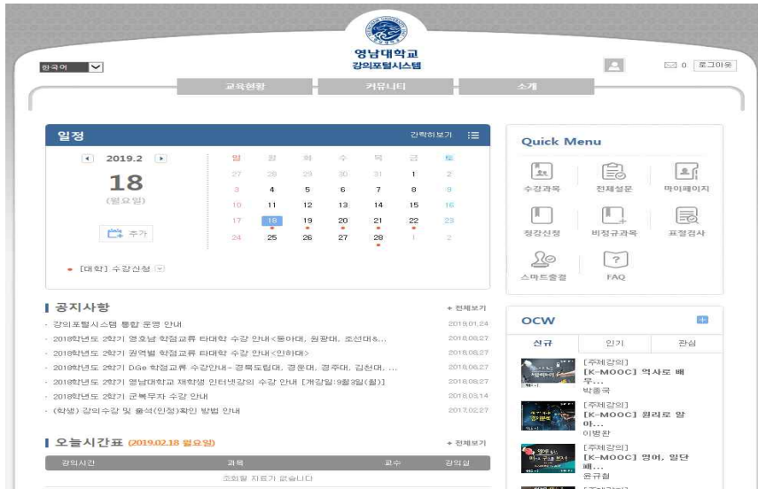
[그림 3] 강의포털시스템 화면