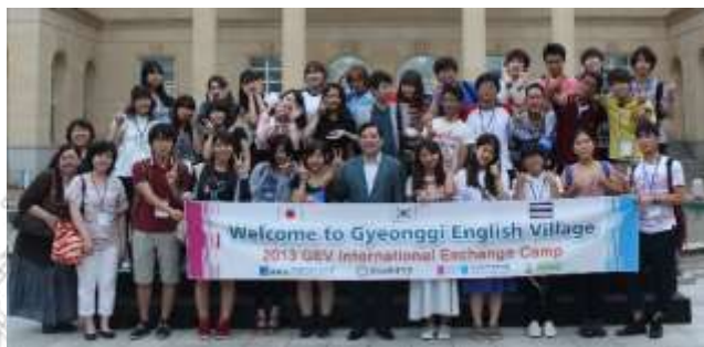
<2013년 9월, 경인교대 & 도쿄교대 & 태국 MSU>