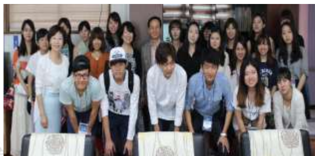
<2014년 9월, 경인교대 & 도쿄교대>